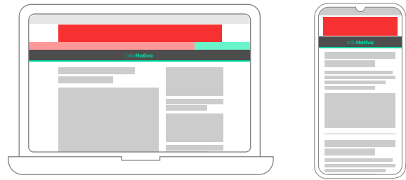
■ Sector destinado al anuncio

Es un anuncio estático y aparece en la parte superior de la pantalla. Es uno de los formatos tradicionales más utilizados por su efectividad en el mercado publicitario digital.