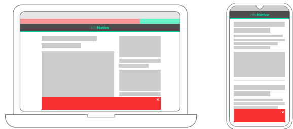
■ Sector destinado al anuncio

Anuncio flotante que se posiciona en la parte inferior de la pantalla del usuario y acompaña el desplazamiento vertical tanto en mobile como en desktop. Es decir que está siempre visible. El aviso puede ser cerrado por acción del usuario o automáticamente luego de un tiempo determinado.