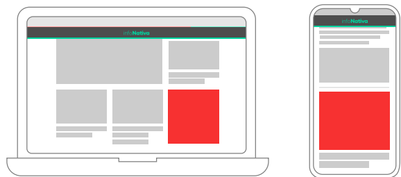
■ Sector destinado al anuncio

Anuncio estático en la tarjeta de cuadrículas del home. También se pueden ubicar dentro de una nota. Es otro de los formatos tradicionales más requeridos, debido a su efectividad en el mercado publicitario digital.